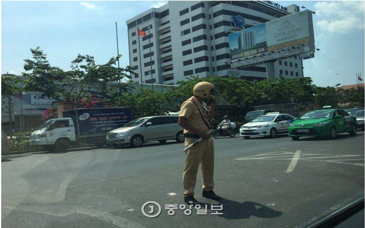
베트남의 교통경찰 제복.

하노이에서는 전·현직 대우그룹 임직원 모임인 대우세계경영연구회가 베트남·미얀마·인도네시아에서 ‘글로벌 청년사업가 양성사업(GYBM)’을 운영하고 있습니다. 한국 대학 졸업생을 선발해 동남아 현지에서 무료로 취업 교육을 제공하는 프로그램입니다. 베트남 호찌민 하노이문화대학 건물에서 교육에 한창인 GYBM 교실을 가봤습니다.