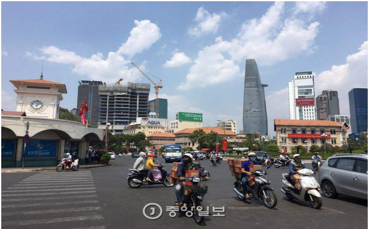
한창 경제가 발전하고 있는 호찌민 시내.

어린 시절 TV에서 우리나라 상사맨들의 스토리를 다룬 다큐멘터리를 본 적이 있습니다. 배경이 베트남으로 기억합니다. 그때 워낙 인프라가 부족한 시절이라 상사맨들은 그야말로 맨땅에 헤딩하는 수밖에 없었습니다. 마을 잔치가 있으면 무작정 찾아가서 닭을 잡으며 친분을 쌓는 식이었죠.