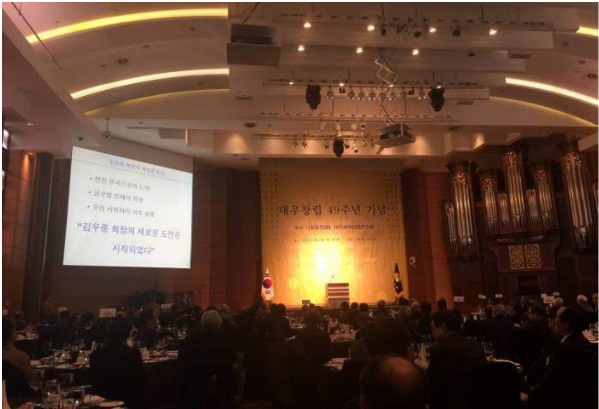
〈대우세계경영연구회(회장 장병주)는 22일 저녁 대우그룹 창립 49주년 기념행사를 서울 양재동 엘타워에서 개최했다.〉

대우그룹이 창립 50주년을 1년 남겨뒀다. 김우중 전 대우그룹 회장의 ‘청년글로벌경영’으로 주목받으면서 대우그룹의 가치도 재조명될지 주목된다.