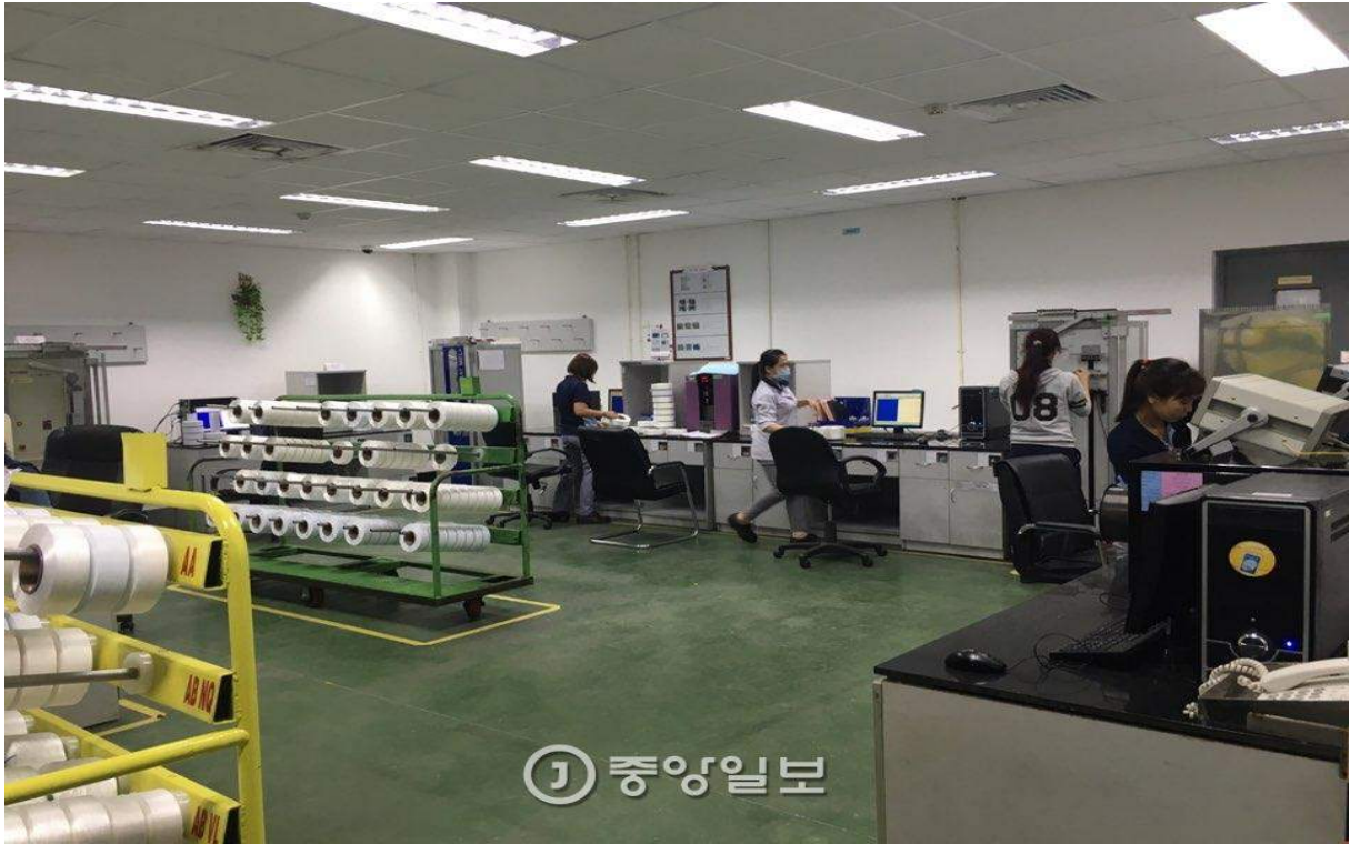
효성 공장에서 근무 중인 여성 현지 근로자. 호찌민=문희철 기자

베트남이 아직 공산국가인지라 경찰(공안)이 뒷돈을 요구하는 일도 공공연히 벌어진다고 합니다. 현지인들에 따르면, 통상 300 만 동(약 15 만원) 정도를 올려두면 즉각 풀려난다고 하더군요. 외국인이라서 돈이 없다고 하면 친절하게 인근 ATM 기기까지 안내해준다는 말도 들었습니다. ^^;