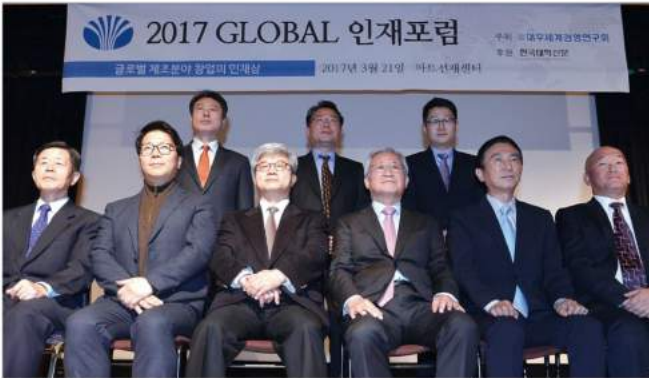
다우세계경영연구회는 지난 21일 6년간 이어온 글로벌 YBM 프로그램을 되돌아보고 앞으로 해외진출의 미래를 전망해보는 '글로벌 인재포럼'을 개최했다.