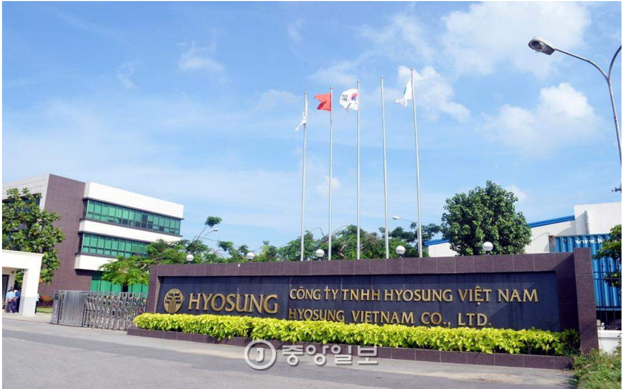
효성 베트남 법인 전경.

호찌민에서 가장 유명한 기업은 효성입니다. 호찌민 1시간 거리인 연짜공장에서 스판덱스·타이어코드·스틸코드 등 3개 공장을 운영하고 있습니다. 효성 사무직 근로자들이 착용하는 파란색과 흰색 모자가 있는데, 이걸 착용하고 호찌민 시내에 가면 대우가 달라진다고 합니다. 전체 베트남 수출금액의 1%를 바로 여기 효성 공장에서 생산한다고 하더군요.